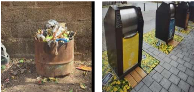
Figure 4 : Image d'une poubelle à Ouaga et proposition nudging

Dans une autre mesure, ce dispositif « nudging » met l'accent sur le caractère attractif rendu possible par la décoration qui force l'admiration et invite les populations à prendre du plaisir à s'en servir pour ainsi rendre le cadre de vie propre. Plus qu'une poubelle, elle est un objet décoratif. Dans une autre mesure ce dispositif permet d'offrir « une architecture de choix qui modifie de façon prévisible le comportement des gens » 32 .