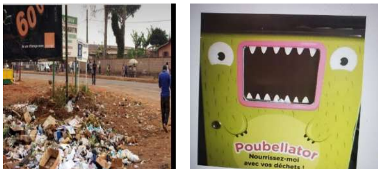
Figure 5: image d'une poubelle de la ville de Ouagadougou et proposition nudging

Comme nous pouvons le constater, l'image de droite offre une plus grande possibilité de choix aux utilisateurs des poubelles. Cette possibilité appelée architecture de choix, nous l'avons susmentionné, par Thaler et Sunstein s'inscrit non seulement dans la dynamique de l'attractivité, mais aussi de l'hygiène et de conscientisation.