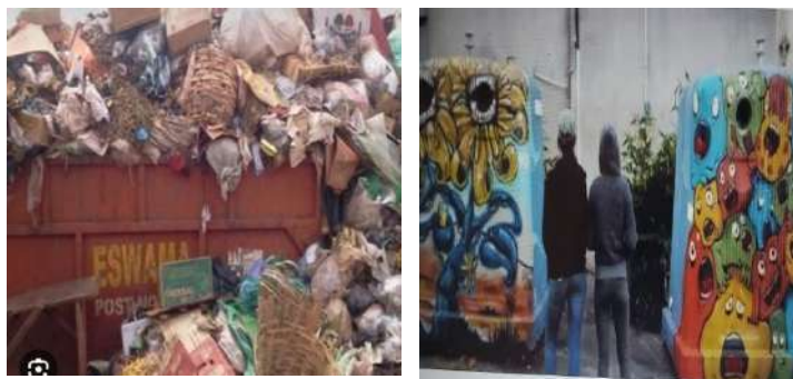
Figure 3:: image d'une poubelle de la ville de Ouagadougou et proposition nudging

La méthode douce se présente dans le cadre des nudges comme non-agressive et dépourvu de tension, elle permet, pour paraphraser Thaler et Sunstein, « d'inspirer la bonne décision ». Pour nous en convaincre, observons cette série d'images dont celle de la gauche est la situation réelle de l'occupations des déchets dans la ville de Ouagadougou et celle de la droite est une proposition « nudging » pour « soigner » les manquements des images de la gauche.