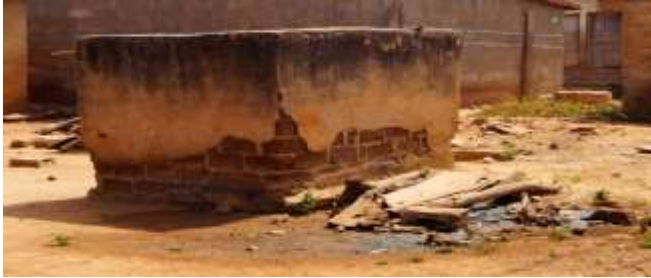
Photo 1 : stagnation d'eau usée dans une cour au quartier Dioulabougou

n'existe pas de réseau d'assainissement « eau usées » ni de réseau de drainage « eaux pluviales » au sein de cette ville. Vue l'absence de caniveaux et de fosses septiques, 94% des ménages déversent les eaux usées dans les rues. Les populations cohabitent avec les eaux usées qui stagnent dans les rues et autour des habitations (voir photo 1).