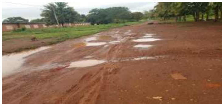
Photo 3 : dégradation de la route principale de la ville de Sandeguie