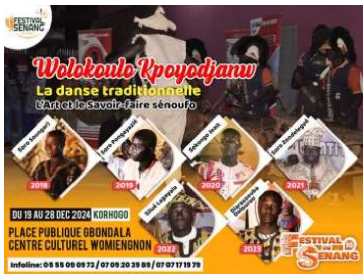
Photo3 : les lauréats du concours wolokoulo kpoyodjanw