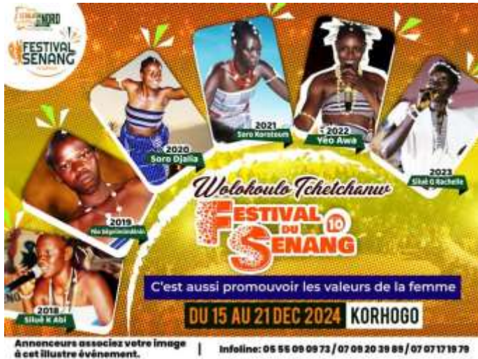
Photo2 : les lauréates du concours wolokoulo tchetchanw

senoufo, la danse senoufo ainsi que le costume traditionnel de ce peuple 7 .