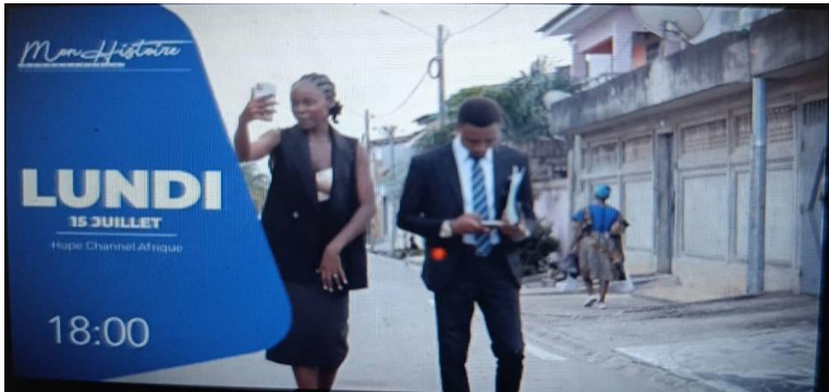
Image d'illustration 1 : Série Mon Histoire , Episode Connectée , Affiche du film